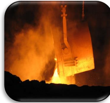
Industri - O&G