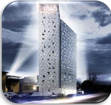
Bygg og bolig